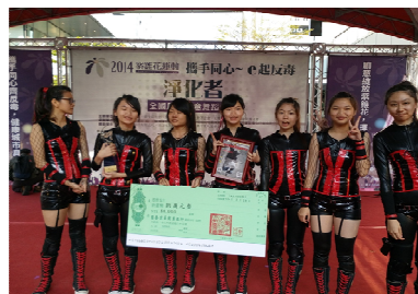
反毒活動宣導獲佳績