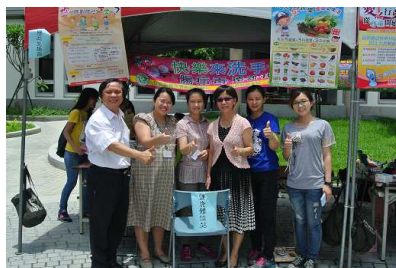
校慶結合衛生所宣導