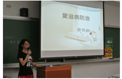
愛滋病防治入班宣導