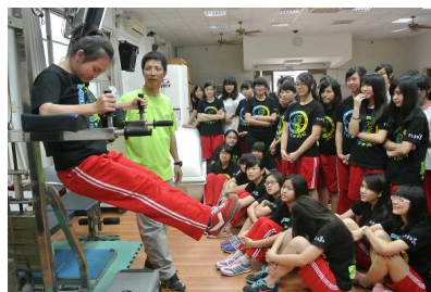
體育老師指導強化肌力