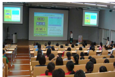
健康體位專題演講