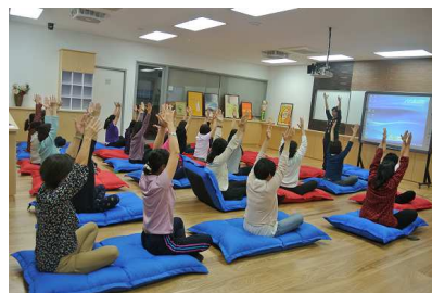
教師健促成長社群