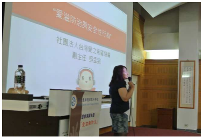
愛滋病防治專題講座