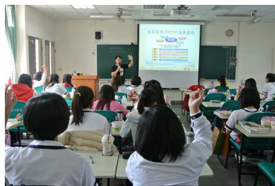
健康體位入班宣導