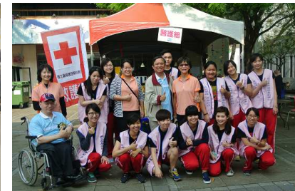
保健志工參與救護站