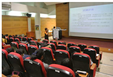
菸害防制專題講座