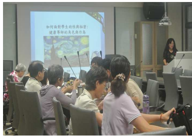
老師知能研習-性教育