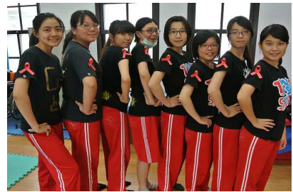
配戴紅絲帶響應愛滋