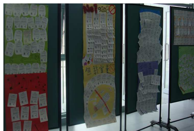
無菸宣誓創意海報展