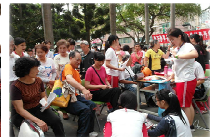
社區服務-生理檢測