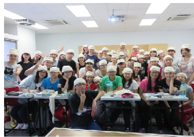
畢業班生取得 BLS 證照