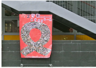
愛之行動-紅絲帶海報