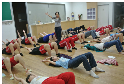
體控班彼拉提斯課程