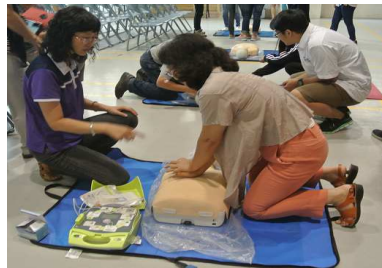
教職員工 CPR 操作