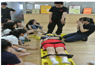
保健服務隊之急救教育